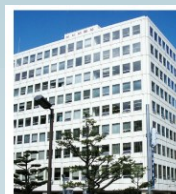
TKP札幌ビジネスセンター赤レンガ前 北海道札幌市中央区北4条西6丁目1 毎日札幌会館(事務所5F)

共催 (公社) 北海道社会福祉士会 (一社) 北海道精神保健福祉士会 (一社) 北海道介護福祉士会